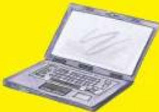
el ordenador portátil