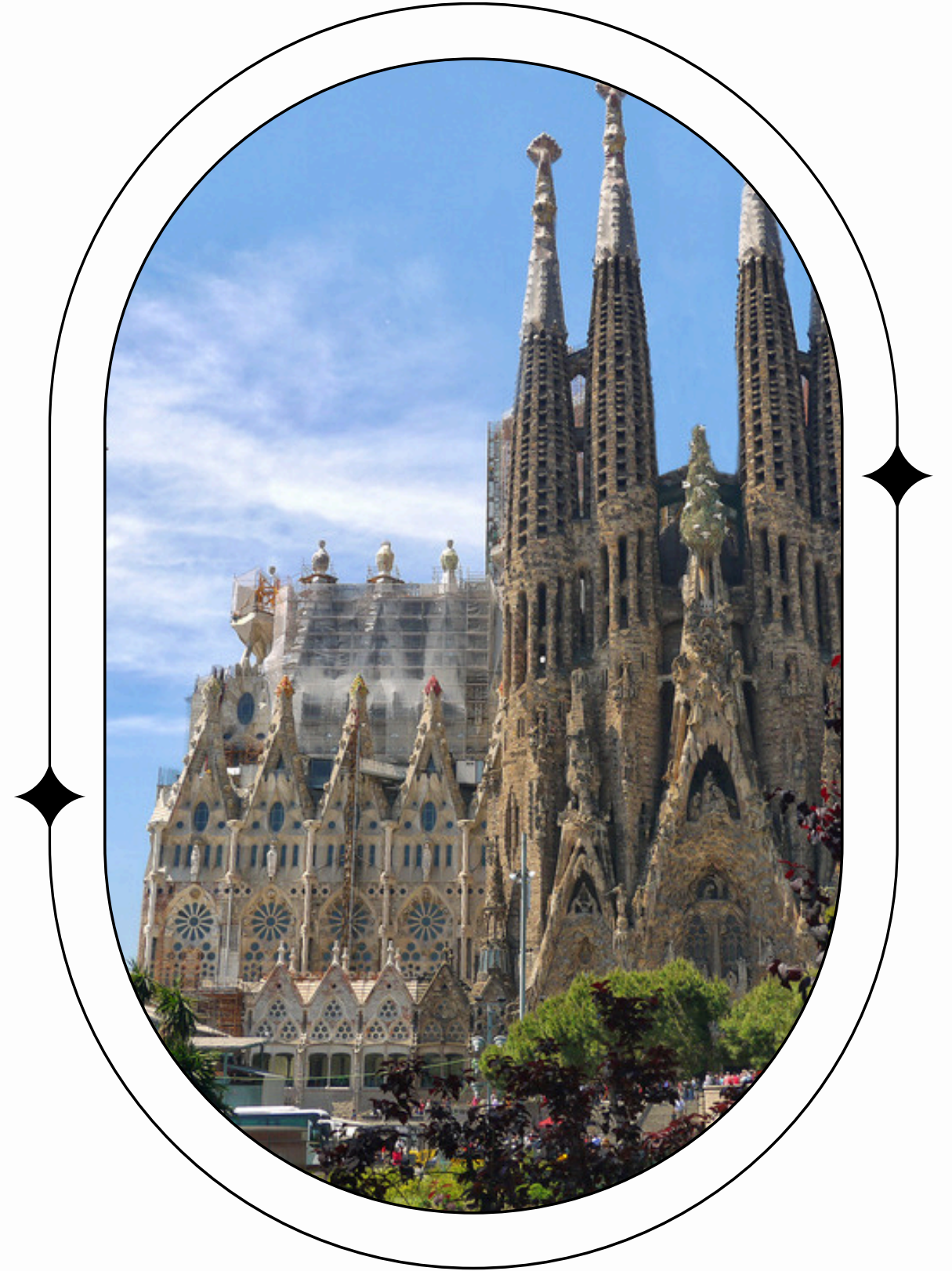
Imagen de la Sagrada Familia o una panorámica de la ciudad

Una de las ciudades más fascinantes de Europa